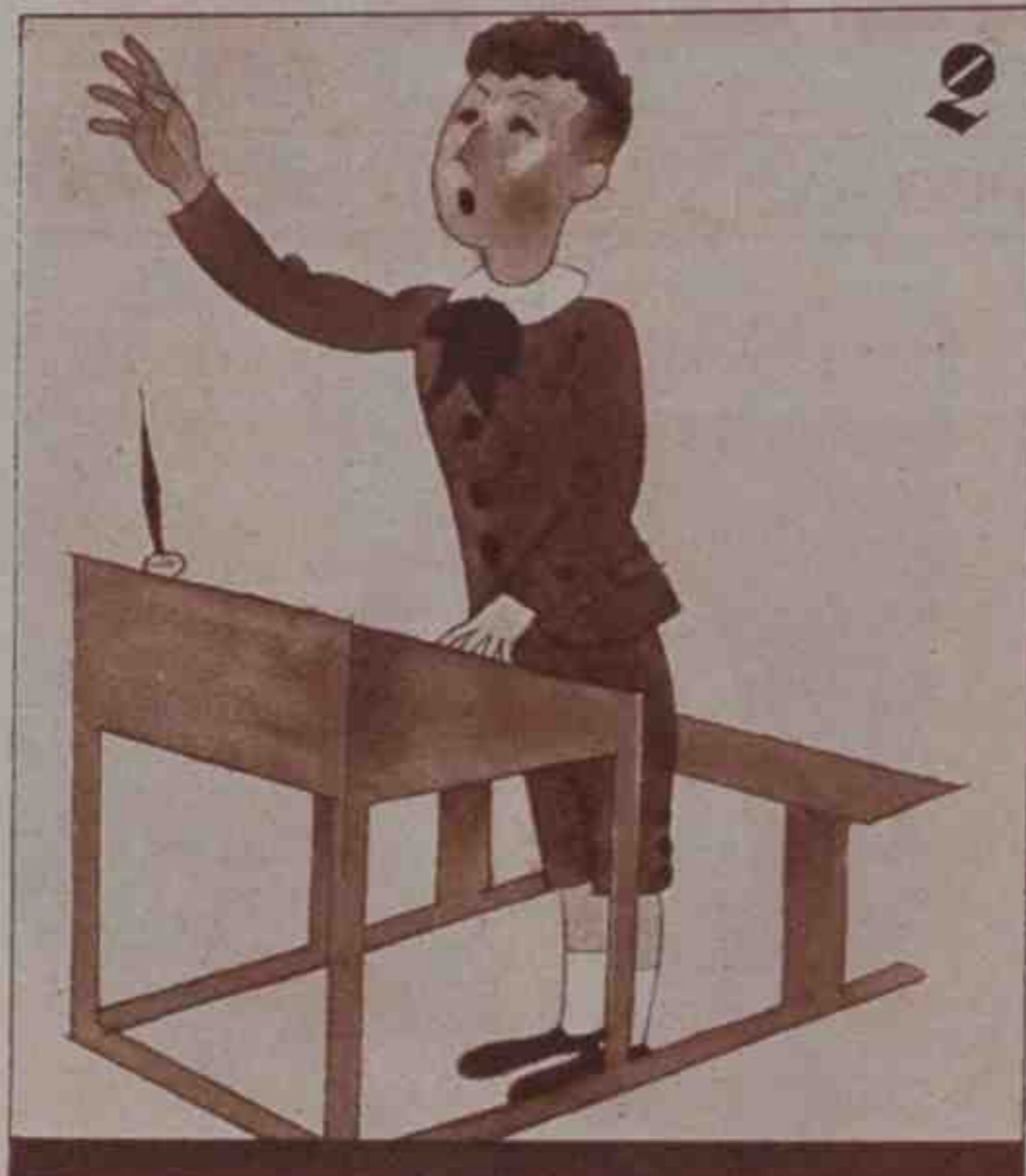
2 Fue al Instituto de Cibra y allí pidió la palabra