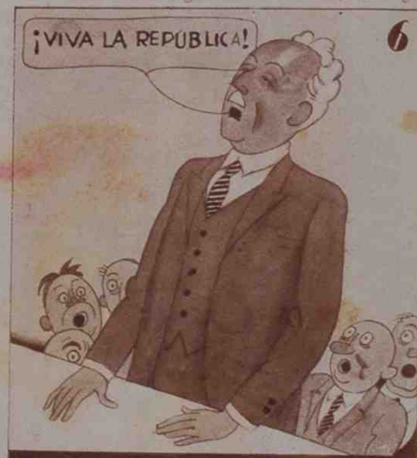
6 Un buen día, dio fe pública de adhesión a la República