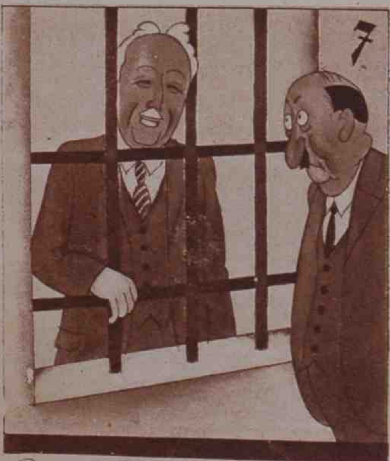
7 Le costó su bello gesto algunos meses de arresto