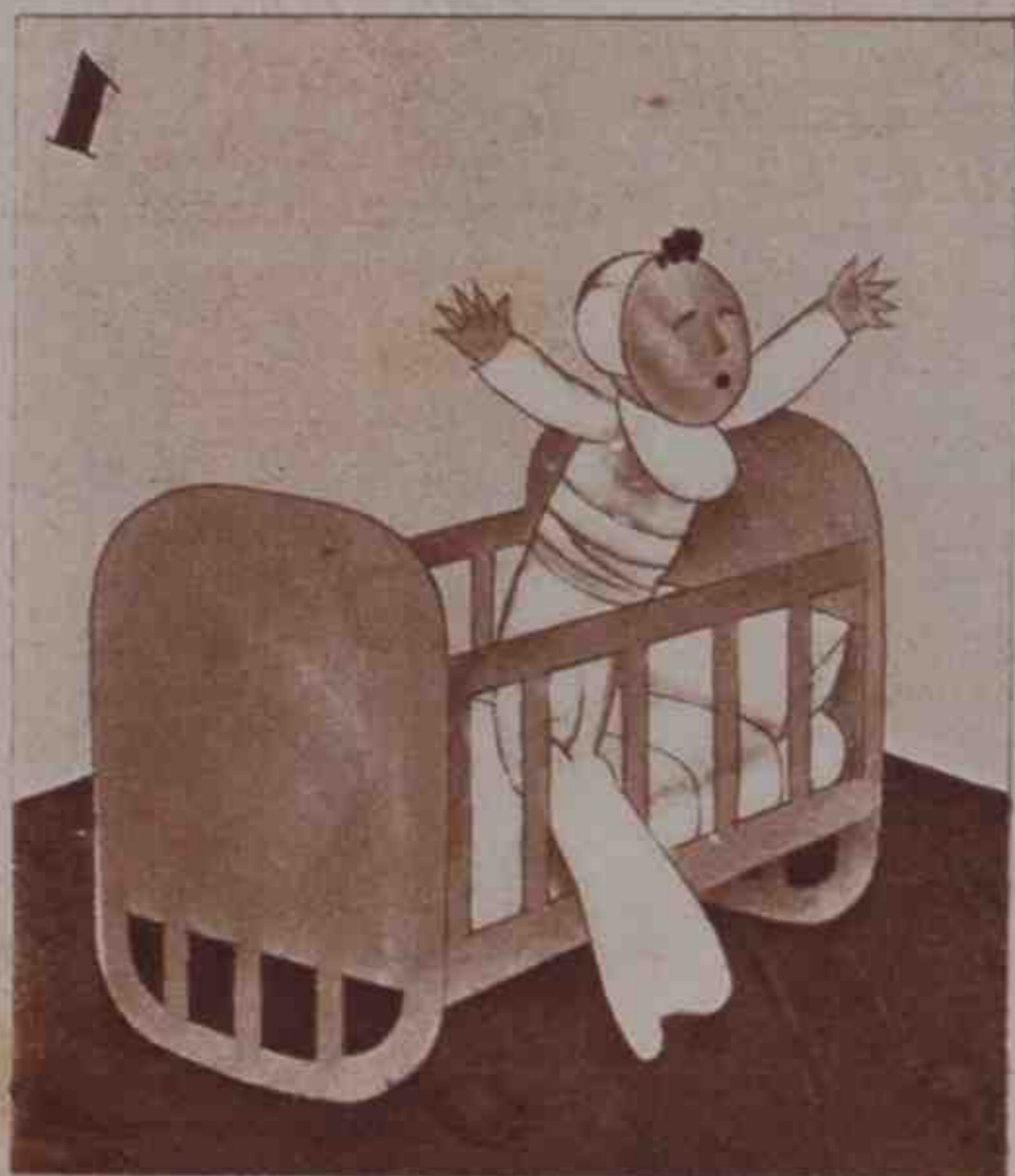
1 Nació en Priego, y nació hablando... como otros nacen llorando