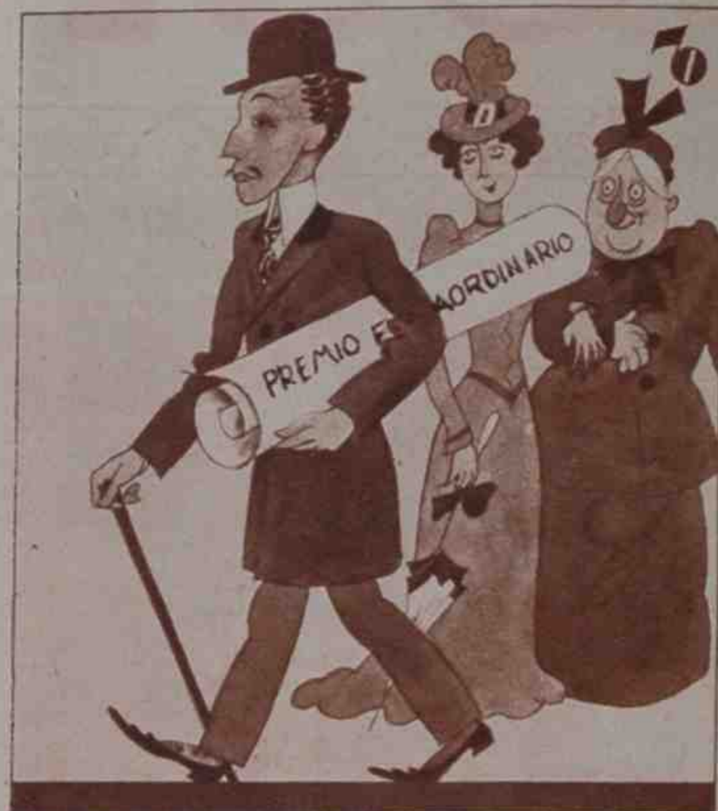
3 En Granada y Madrid, luego dio lustre y honor a Priego