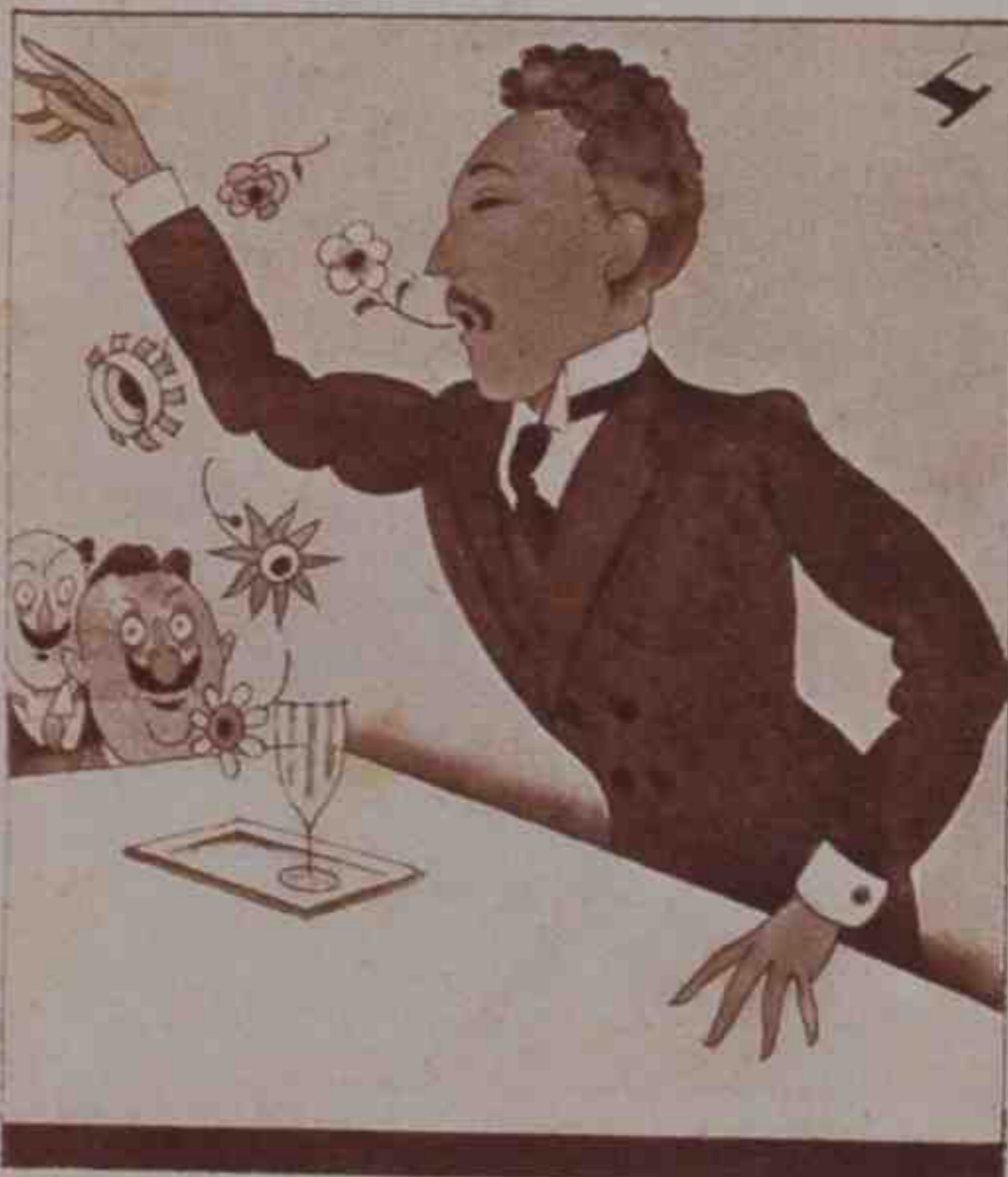
4 Alcanzó fama notoria en las Cortes su oratoria