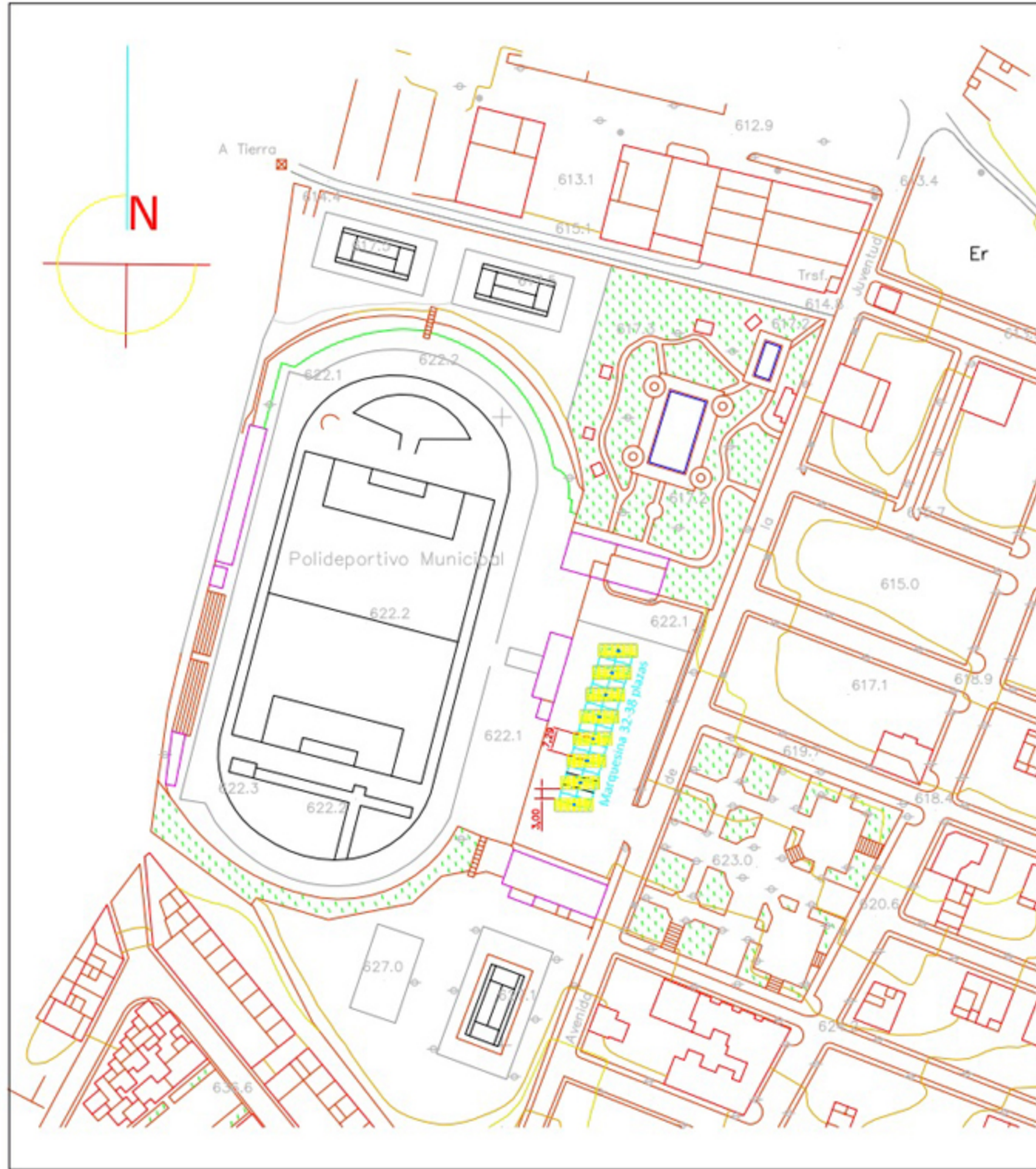
UBICACIÓN DE LA MARQUESINA